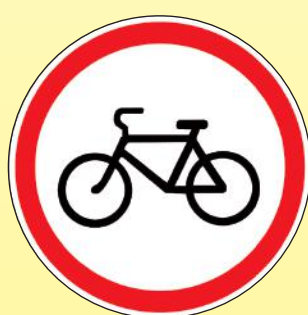
3.9 «Движение на велосипедах запрещено»