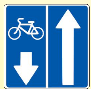
5.11.2. «Дорога с полосой для велосипедистов»