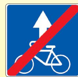
5.14.3. «Конец полосы для велосипедистов»