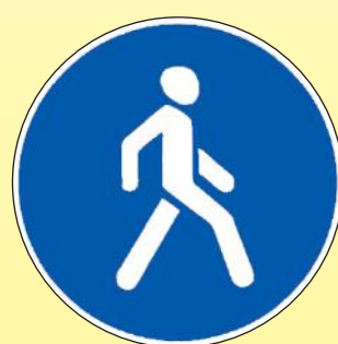
4.5.1 «Пешеходная дорожка»