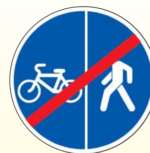
4.5.6. «Конец пешеходной и велосипедной дорожки с разделением движения (конец велопешеходной дорожки с разделением движения)»