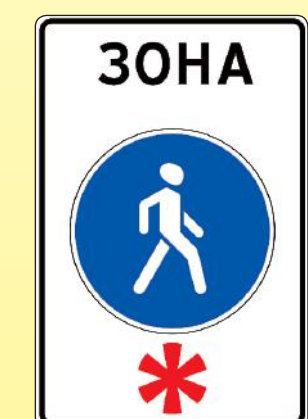
5.33 «Пешеходная зона»