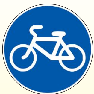
4.4.1. «Велосипедная дорожка»