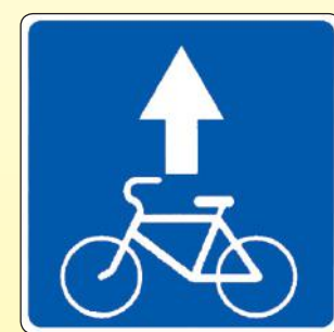
5.14.2. «Полоса для велосипедистов»