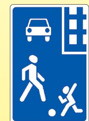
5.21 «Жилая зона»