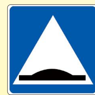
5.20. «Искусственная неровность»