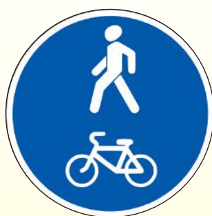
4.5.2. «Пешеходная и велосипедная дорожка с совмещенным движением (велопешеходная дорожка с совмещенным движением)»