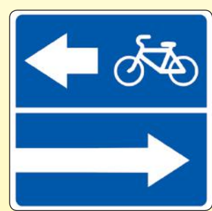
5.13.3. «Выезд на дорогу с полосой для велосипедистов»