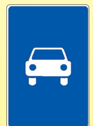
5.3 «Дорога для автомобилей»