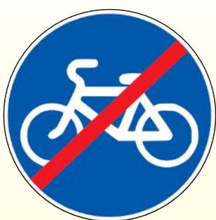
4.4.2. «Конец велосипедной дорожки или полосы для велосипедистов»