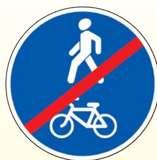
4.5.3. «Конец пешеходной и велосипедной дорожки с совмещенным движением»