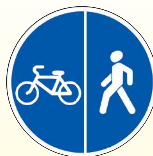
4.5.4. «Пешеходная и велосипедная дорожки с разделением движения»