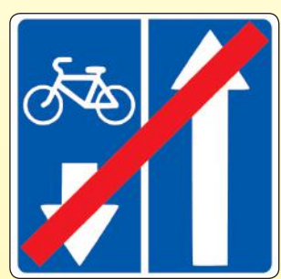
5.12.2. «Конец дороги с полосой для велосипедистов»