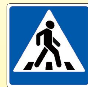
5.19.1. «Пешеходный переход»