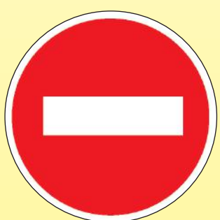
3.1 «Въезд запрещён»